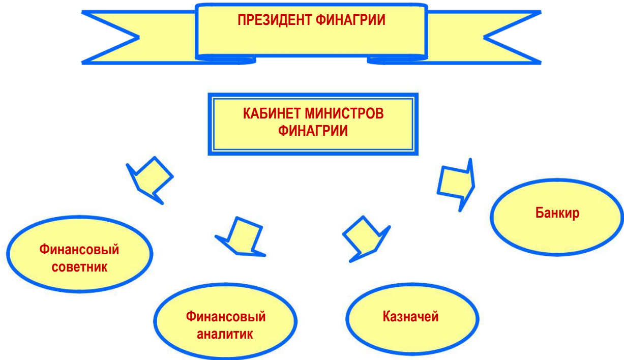
рис. 1. Иерархия управляющей команды Финагрии