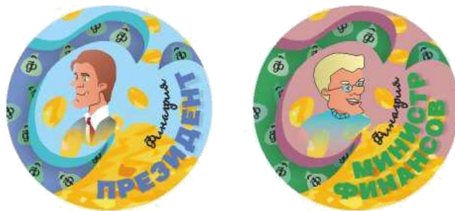
рис. 3. Отличительные знаки президента и министра финансов Финагрии