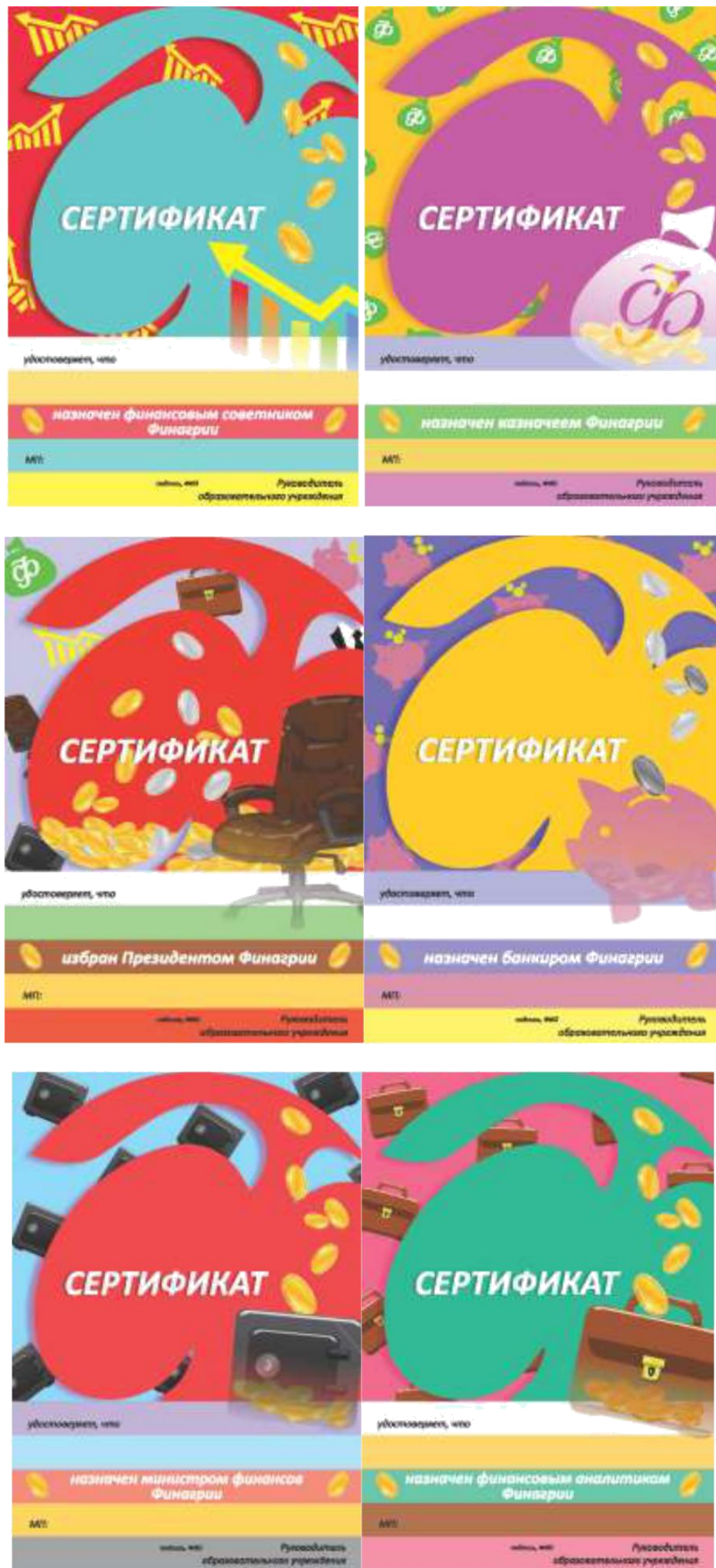
рис. 4. Сертификаты управляющей команды Финagri